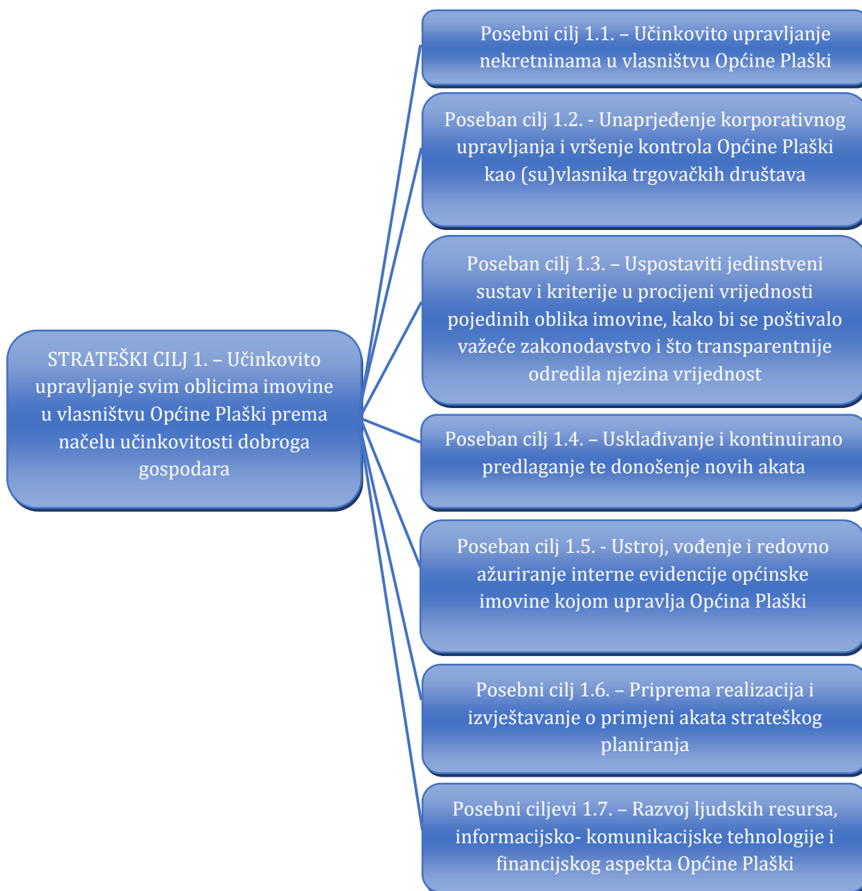
Slika 2. Kaskadiranje strateškog cilja upravljanja općinskom imovinom